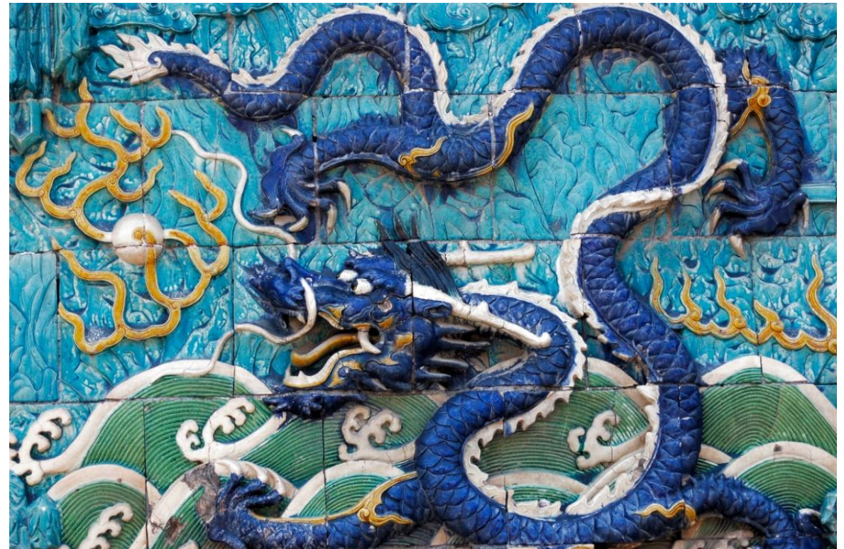
Foto: Simbología china del eclipse de sol, por Nicolás Ortego China 2009

Fue asesor de Historia en la película "Ágora" de Alejandro Amenábar, entre otras muchas actividades extra-académicas.